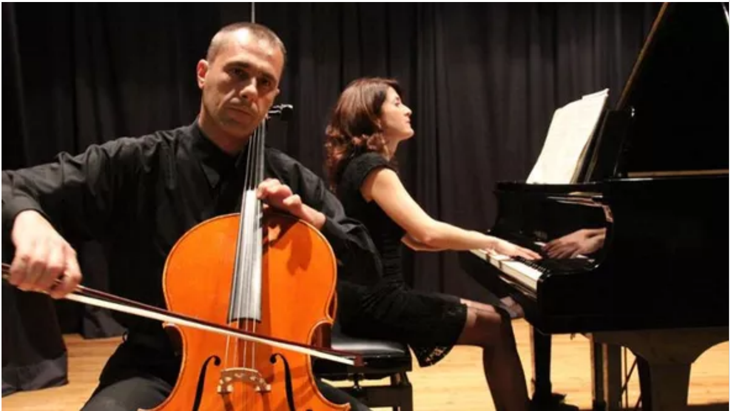
"Scoprимusica": Lo Spazio Vuoto guida all'ascolto

Paolo Berizzi e le icone di «NazItalia»: «Tolto il fez ci sono le felpe alla moda»